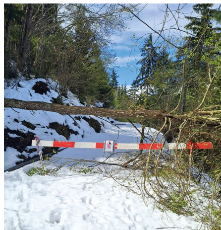
Des barrières à ne pas franchir.

Trois observateurs veillent discrètement sur la sécurité de la Commune, assurant une surveillance constante des zones à risque.